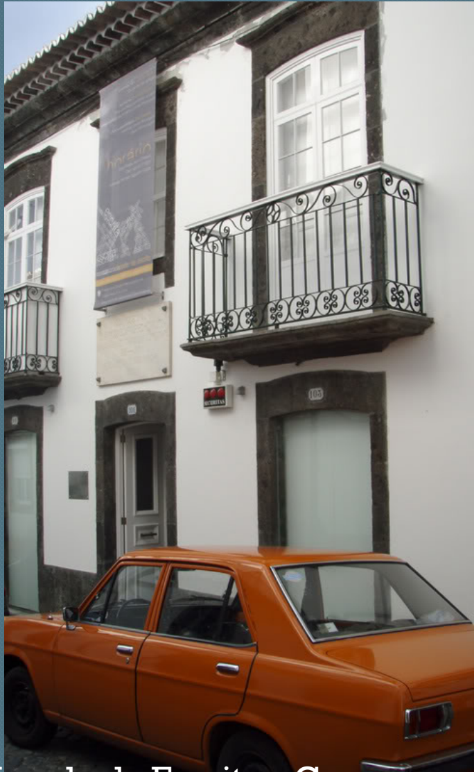
Morada da Escrita – Casa Armando Côrtes-Rodrigues, em Ponta Delgada

A Morada da Escrita é um espaço cultural inaugurado em Janeiro de 2007.