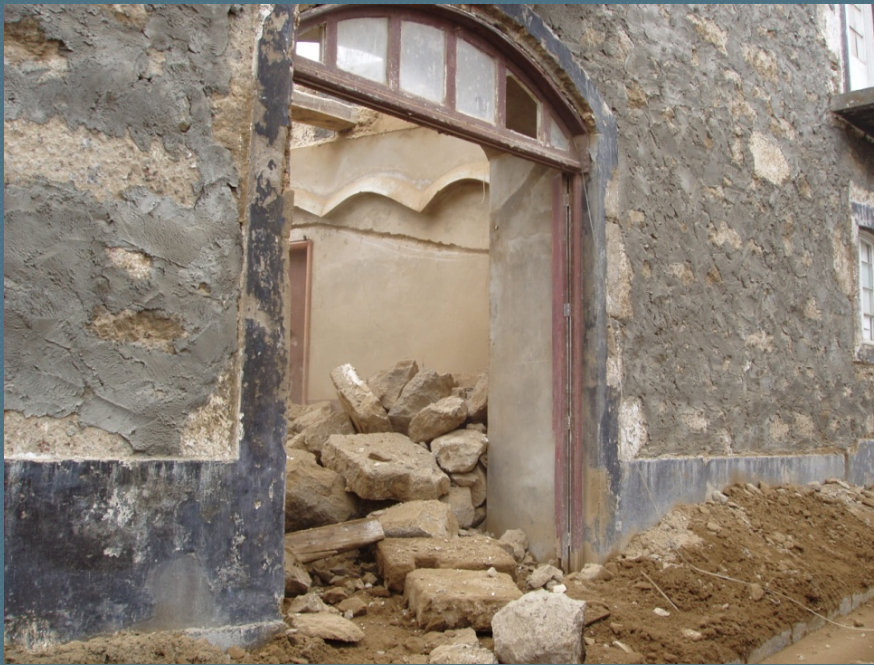
Trabalhos de demolição do interior

A casa encontrava-se quase em ruínas e foi comprada pela Santa Casa da Misericórdia de Vila Franca do Campo, para aí instalar uma Creche e um Jardim-de-infância.